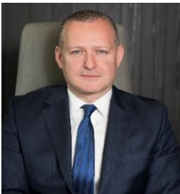
Mert Öncü Yapı Kredi Bankası A.Ş.