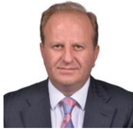
A. Önder Özpamukçu Koçtaş Yapı Marketl. A.Ş.