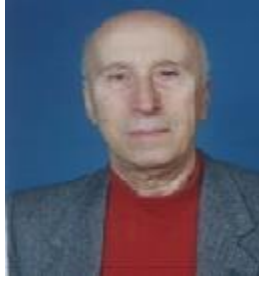
Samim Şeren Koç Holding A.Ş. 26 Ocak 2022'de vefat etmiştir.