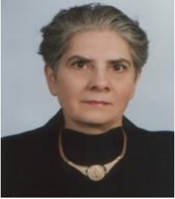
Bilge Sezin Otomobil Lastikleri Tevzi A.Ş. Koç-Yönder YK Sayman Üyesi 02 Mart 2022'de vefat etmiştir.