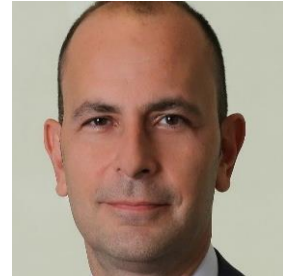
Emir K. Alpay Yapı Kredi Portföy